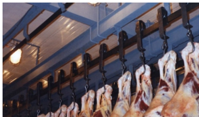
Protección de gancheras en Frig. Reg. Gral. Las Heras

Converttech Z ; Converttech PLATA / Converttech Zinc Mastic