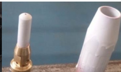
Toberas protegidas con XERAMIC 390