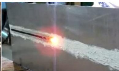
Soldadura con FT-100