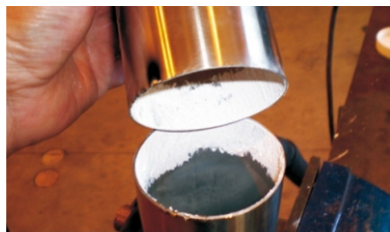
Aplicación de FT-100 para soldadura en cañería