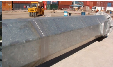
Reparación de galvanizado de estructuras en Puerto Bs. As.