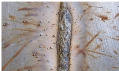
Soldadura sin tratamiento, proyecciones (spatters) adheridas