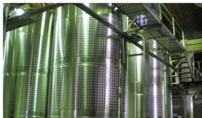
Aplicación en tanques Ind. Alimenticia

Genox LQF; Genox PROTEC; Pulinox; Desiteq