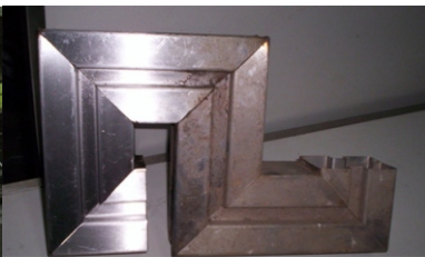
Pieza de Acero Inoxidable limpiada con Genox LAD