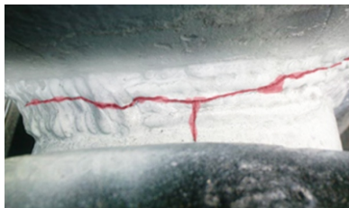
Fisura detectada en cordón de soldadura