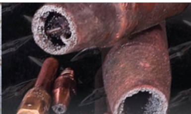
Estado de torchas luego de funcionar sin protección