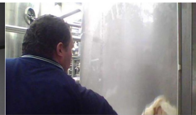
Aplicación en tanques Ind. Alimenticia