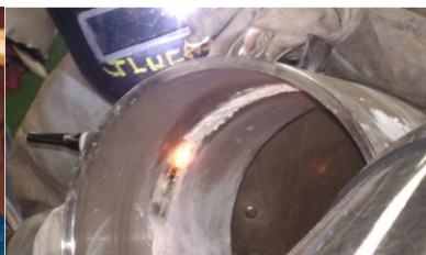
Soldadura con FT-100