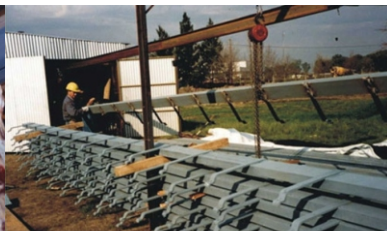
Protección de prefabricados en Disco Ahold