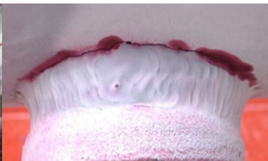
Fisura detectada en cordón de soldadura