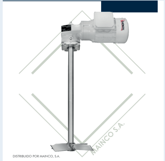
DISTRIBUIDO POR MAINCO, S.A.